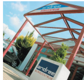
Mit Buchsbäumen: Der Eingang des Bürozentrum Andree.